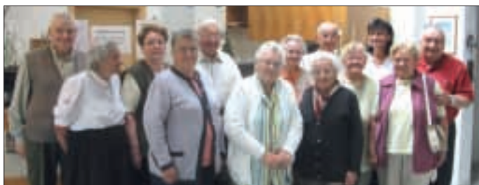
Seniorenurlaub in Mitterbach. Eine Gruppe der Senioren von Hohenwarth-Mühlbach verbrachte Ende Juni eine Woche Seniorenurlaub in Mitterbach bei Maria Zell. Zwei interessante Ausflüge im Ötschergebiet rundeten eine angenehme Urlaubswoche ab.