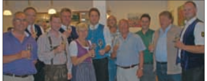
Der Musikverein Manhartsberg feierte im Jubiläumsjahr mit zahlreichen Gästen das 20-jährige Bestandsjubiläum.