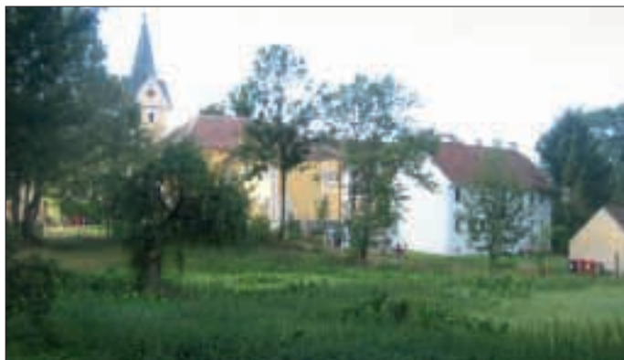
Auf diesem Areal in Mühlbach soll eine neue Wohnhausanlage entstehen. Interessenten für die Wohnungen gesucht.

Im Rahmen einer Feierstunde werden am 30. September die beiden Wohneinheiten im südlichen Ortsbereich von Hohenwarth eröffnet und offiziell ihrer Bestimmung übergeben. Insgesamt hat die „Austria AG“ hier in den letzten zehn Jahren 24 Wohnungen errichtet, die nach einer etwas schwierigen Anlaufphase vergeben werden konnten. Die Bewohner genießen den nach Osten liegenden Grünbereich und die angenehme Ruhe. Eine Wohn- und Lebensqualität, die auch im ländlichen Bereich nicht mehr als selbstverständlich gilt . . .