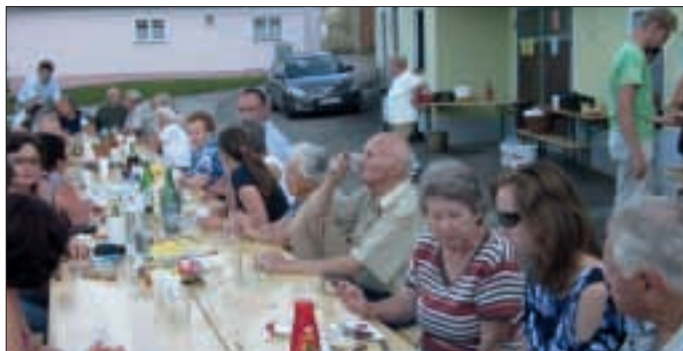
„Zemlinger Vorstadtfest 2011“ - Das Fest am 20.8. war sehr gut besucht und ein vergnüglicher Nachmittag für Jung und Alt. Wir hatten Glück mit dem Wetter, das Fest ging bis in die späten Abendstunden. Der Reinerlös ging an FF-Zemling.

Die beiden Feuerwehrmitglieder haben unter tropischer Hitze das Bewerbsziel mit gutem Erfolg erreicht und konnten das Wasserdienstabzeichen in Silber erwerben. Weitere Infos unter der neuen www.ff-muehlbach.at