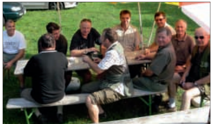
Am 21. August fand am Schießplatz in Ebersbrunn das Hegeringschießen des Hegeringes Mühlbach statt. Im Bild einige der teilnehmenden Jäger in gemütlicher, schattiger Runde.