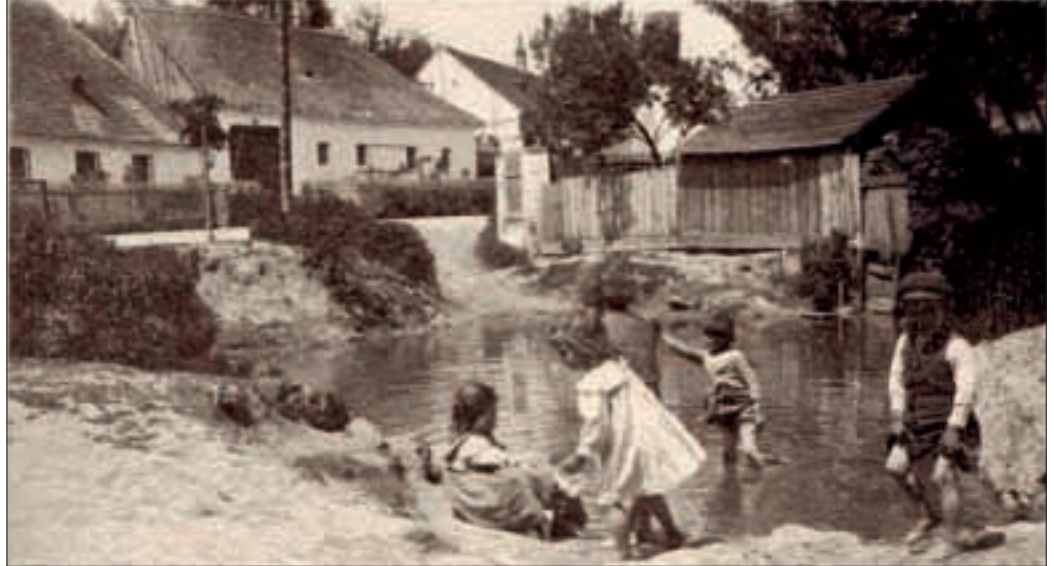
Die „Schwemm“ - ein durch eine Barriere erzeugtes künstliches Becken des Gscheinzbaches. Sie diente als Wasserspeicher für die Feuerwehr und existierte bis Anfang der 1960er-Jahre.

Sowjetunion bezeichnet). Beim im Juni entflammten Koreakrieg standen sich die beiden Lager das erste Mal militärisch gegenüber, weil sie nicht nur mit militärischem