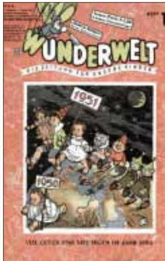
Wunderwelt Heft 1 aus 1951.

gestrengen Lehrer Walther Sohm ein Dorn im Auge (ich weiß bis heute nicht, warum), deshalb mussten die Hosenbeine beim Schulgang wieder lang getragen werden. Man konnte aber durch den entstandenen Bug leicht