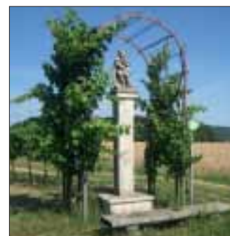
Im Bild das sogenannte „Mauthkreuz“ in Ronthal.

Auch unsere Gemeinde verfügt über zahlreiche sehenswerte Natur- und Kleindenkmäler. Um diese wertvollen Kulturgüter zu digitalisieren, beteiligte sich die Gemeinde am Kooperationsprojekt „Kleindenkmäler - Zeichen unserer Kulturlandschaft“, das in 5 niederösterreichischen LEADER-Regionen durchgeführt wurde.