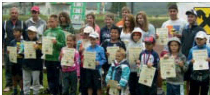
Der Tennisverein Mühlbach hat im Frühjahr und Sommer wieder sehr viele Jugendaktivitäten durchgeführt. Auf dem Foto die zahlreichen Teilnehmer eines Tenniscamps in den Schulferien auf der Tennisanlage in Mühlbach. - Ein ausführlicher Bericht über die Aktivitäten erfolgt in der Dezember-Ausgabe.