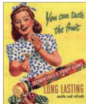
Original-Hülle eines „Chewing Gum“ von 1951

habe das „Kochbuch für ländliche Haushalte“ von Karoline Meindl-Dietrich vor mir, das in unzähligen Ausgaben immer wieder neu aufgelegt wurde - die 60. Auflage erfolgte 2006. In meiner sehr alten Ausgabe steht: „Hühner werden nach dem Betäuben durch einen Halsaderschnitt unmittelbar unter dem Kopf beim Ohrläppchen getötet oder man fährt mit einer Schere durch den Schnabel nach rückwärts und schneidet dort die Schlagader ab.“ - Das wird man heute in Kochbüchern vergeblich suchen. Ich sehe noch meine Mutter vor mir, wie sie am Sonntagmorgen mit